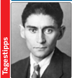
Vor 100 Jahren, am 3. Juni 1924 ist Franz Kafka gestorben