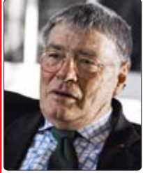
Am Pult in der Berliner Philharmonie stand Jeffrey Tate