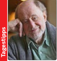
Sir Roger Norrington leitete das Deutsche Sinfonie-Orchester Berlin