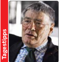
Am Pult in der Berliner Philharmonie stand Jeffrey Tate