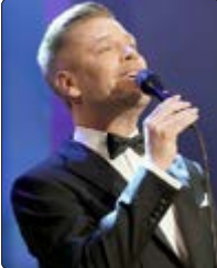
Begleitet wird das Bundesjazzorchester von Tom Gaebel